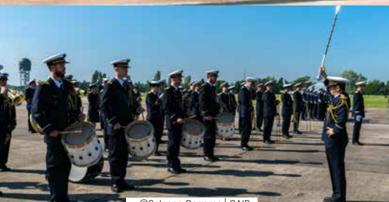
@Solenne Carreras | GAIR