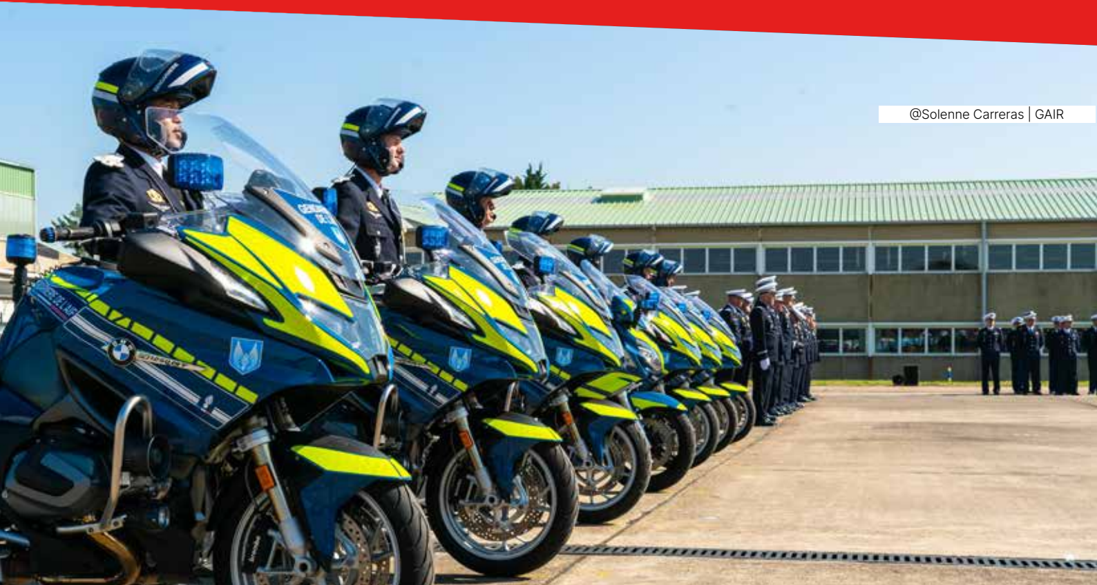
@Solenne Carreras | GAIR