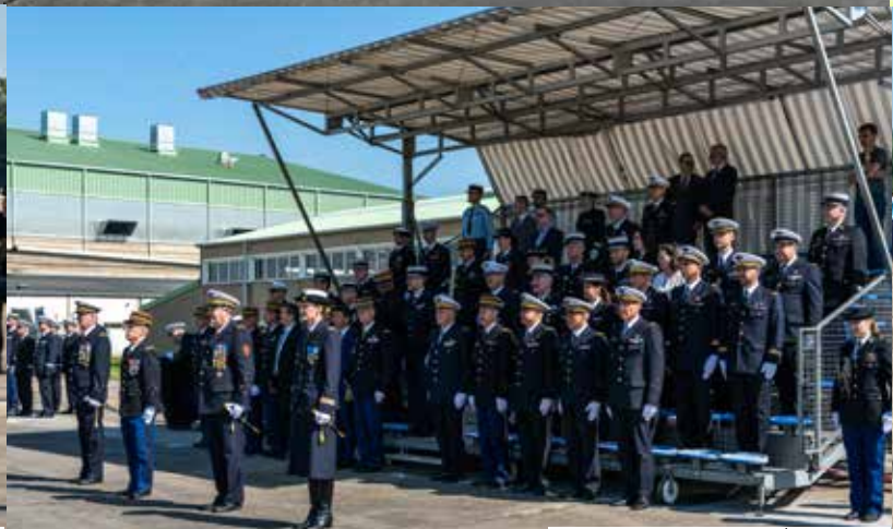
@Solenne Carreras | GAIR