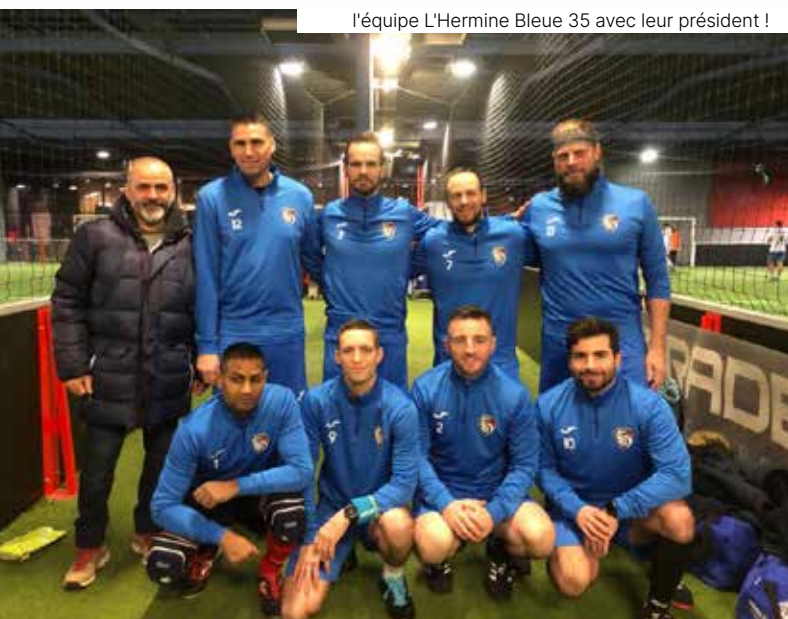
l'équipe L'Hermine Bleue 35 avec leur président !