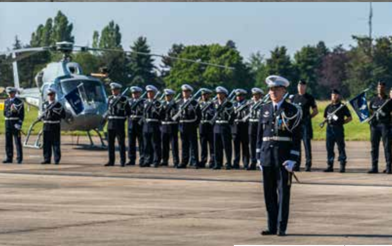
@Solenne Carreras | GAIR