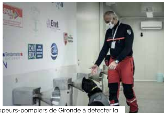
Entraînement de la brigade canine des sapeurs-pompiers de Gironde à détecter la maladie du Covid, à Libourne, le 29 janvier 2021