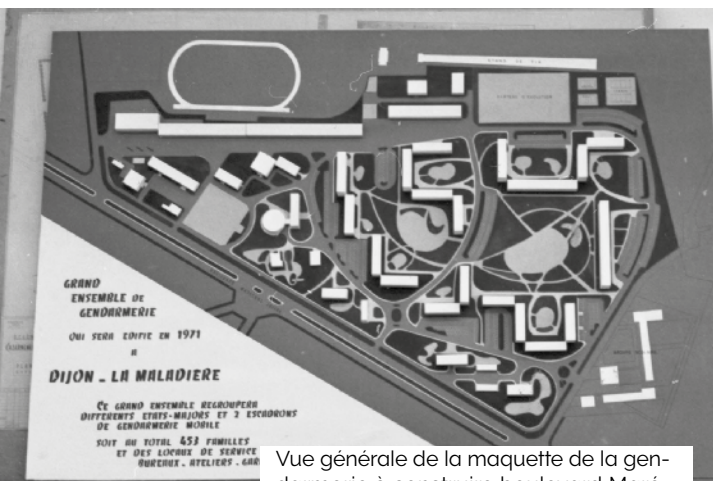
Vue générale de la maquette de la gendarmerie à construire boulevard Maréchal-Joffre.

Le projet de construction d'une nouvelle gendarmerie à Dijon ne date pas d'hier. La question a déjà été soulevée en 1949 et une première étude lancée en 1953. Plus de vingt ans après, cette fois, le chantier paraît en bonne voie.