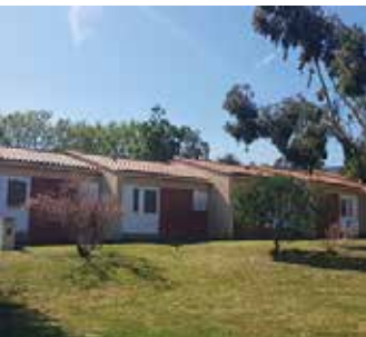
Argèles sur mer