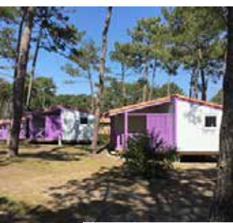
Le Grand Crohot