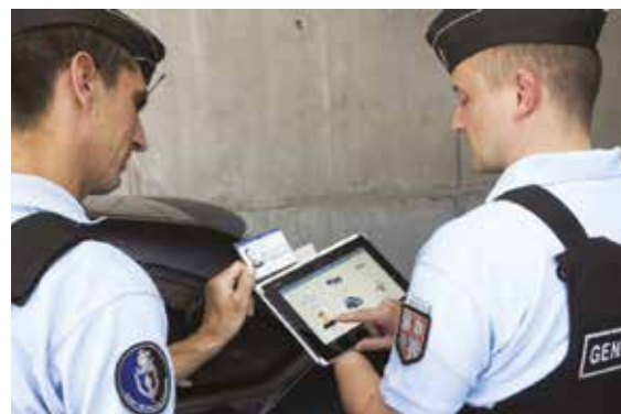
La transformation digitale de l'institution comprend notamment le projet Néogend, c'est-à-dire l'équipement des gendarmes en tablette et smartphone.