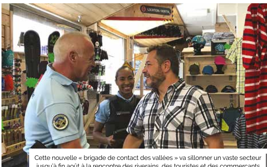
Cette nouvelle « brigade de contact des vallées » va sillonner un vaste secteur jusqu'à fin août à la rencontre des riverains, des touristes et des commerçants.

Avec les grosses chaleurs, vous êtes nombreux à choisir la montagne pour vos vacances. Conséquence, entre touristes et locaux, la population augmente dans les stations et petits villages. Pour assurer la sécurité et maintenir le contact, une nouvelle brigade de gendarmerie vient d'être lancée.